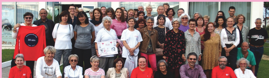
Photo Anniversaire 30 ans - 2019